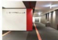
view C 9Fからカンファレンスルーム専用エスカレーターで10Fへ。