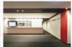
view D カンファレンスルーム専用エスカレーターを上ると左手に受付があります。